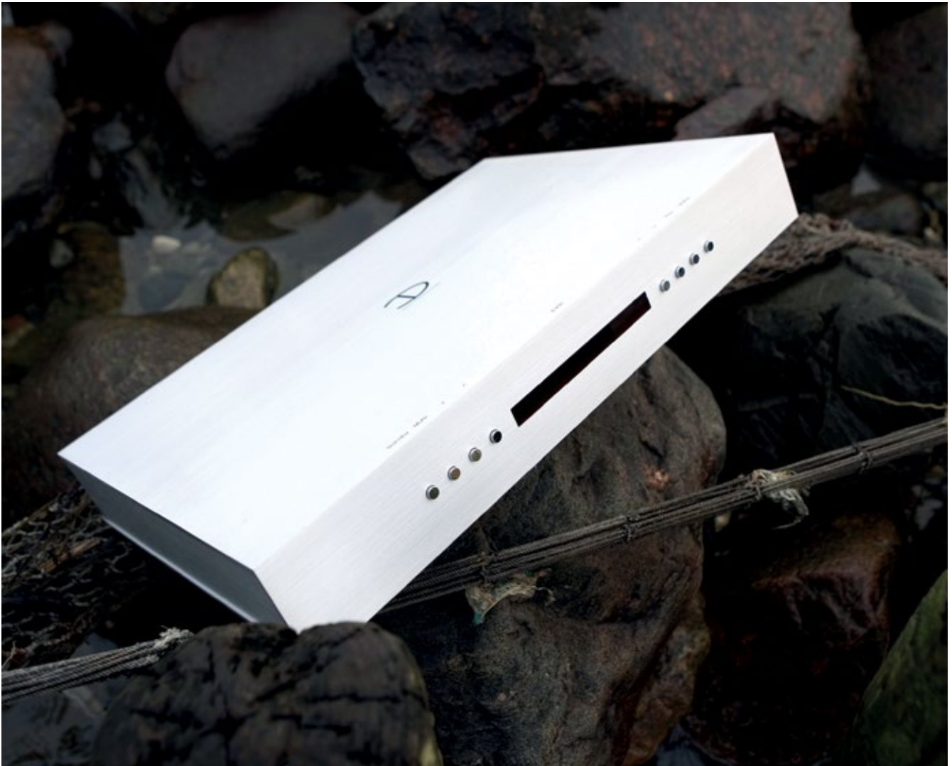
Vollverstärker Densen B-130XS